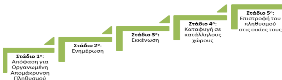
Σχήμα 1. Στάδια υλοποίησης της Ο.Α.Π (ΟΑΣΠ, 2016)

Ο συνολικά αναμενόμενος χρόνος ολοκλήρωσης της διαδικασίας Ο.Α.Π εξαρτάται από το χρόνο διάρκειας του κάθε σταδίου (σχήμα 1).