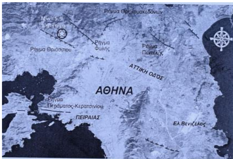
Εικόνα 2. Δορυφορική εικόνα του Λεκανοπεδίου Αττικής με τα κύρια ενεργά και πιθανώς ενεργά ρήγματα (Pavlidis et al., 2002, Gannas et al, 2004, 2005)

Αρκετές ζημιές είχαν εντοπιστεί στο Κερατσίνι από το σεισμό της Πάρνηθας μεγέθους 5,9 βαθμών της κλίμακας Ρίχτερ στις 7/9/1999 2 .