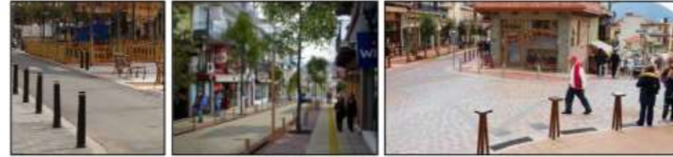
δίοταλο οδών - πεζοδρομίου ΦΩΤΟΓΡΑΦΙΚΟ ΥΛΙΚΟ ΠΑΡΑΔΕΙΓΜΑΤΩΝ