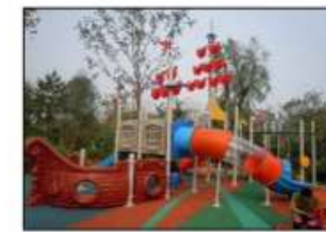
δίοταλο παιδική χαρά ΦΩΤΟΓΡΑΦΙΚΟ ΥΛΙΚΟ ΠΑΡΑΔΕΙΓΜΑΤΩΝ