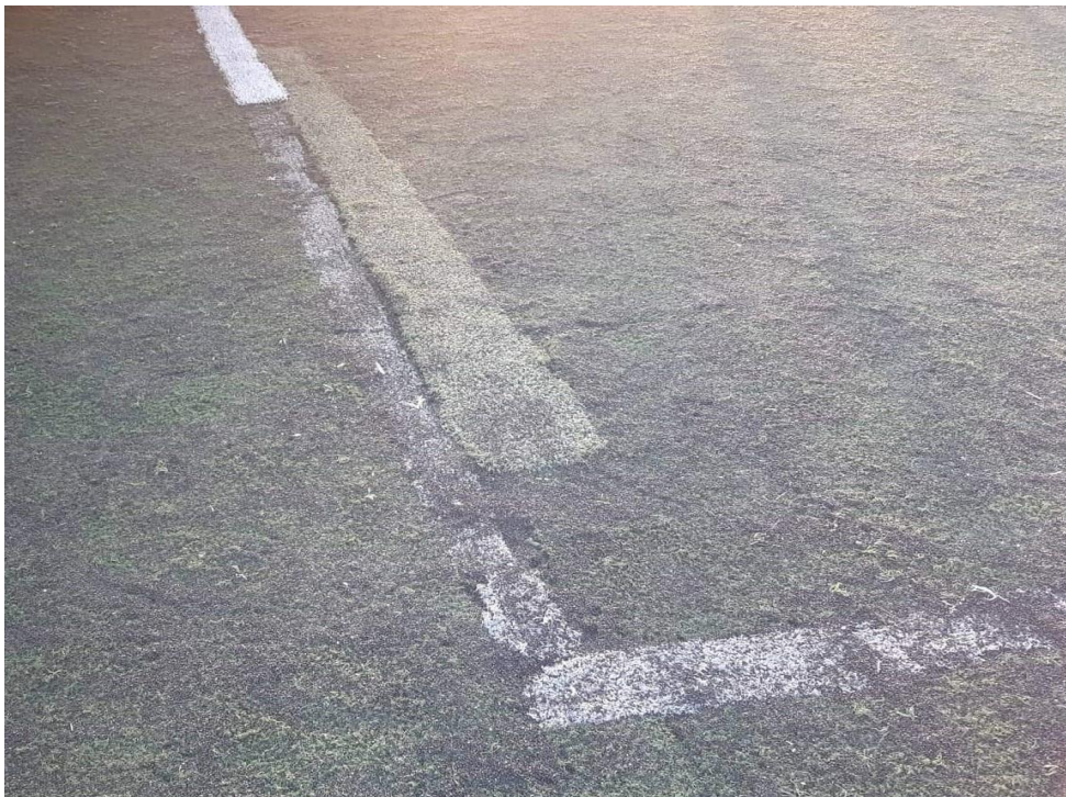
ΕΙΚΟΝΑ 2. ΥΦΙΣΤΑΜΕΝΟΣ ΧΛΟΟΤΑΠΗΤΑΣ “Ι.ΒΑΖΟΣ”