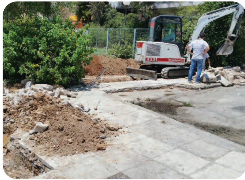
Περίφραξη πλατείας Καρπάθου