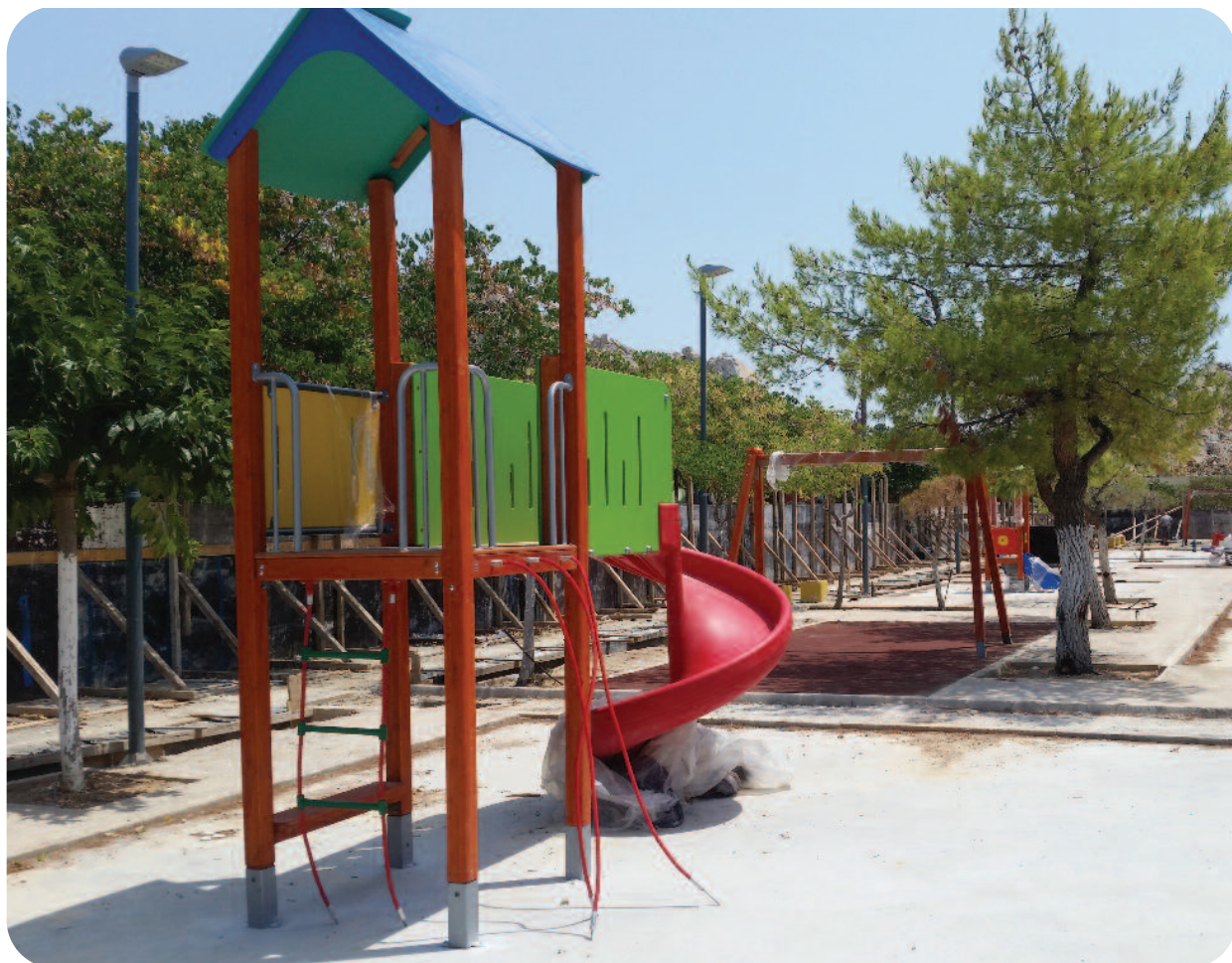
Ανακατασκευή παιδικής χαράς πάρκου Σελεπίτσари

Το να αλλιάξεις λογικές που κυριαρχούν επί χρόνια, δεν είναι καθόλου εύκολη υπόθεση. Χρειάζεται πολύ μεγάλη προσπάθεια, πείσμα και (γιατί να το κρύψουμε;) υπομονή. Οι δυσκολίες πολλές. Πρώτα απ' όλα, βρήκαμε τις δημοτικές υπηρεσίες σε κατάσταση διάλυσης και βαθιάς απαξίωσης. Ειδικά σε ό,τι αφορά τα τεχνικά έργα, χωρίς την ενεργοποίηση της τεχνικής υπηρεσίας του δήμου δεν υπήρχε περίπτωση να πετύχουμε επιτάχυνση των εργασιών με εξοικονόμηση πόρων. Αποτελεί μνημείο παραλογισμού να γίνονται εξωτερικές αναθέσεις την ώρα που ο δήμος διαθέτει εξαιρετικούς μηχανικούς. Η ενεργοποίηση της τεχνικής υπηρεσίας έδειξε τις μεγάλες ανεκμετάλλευτες δυνατότητες της και συνέβαλε στην εξοικονόμηση πόρων. Επιπλέον, το θεσμικό πλαίσιο που διέπει