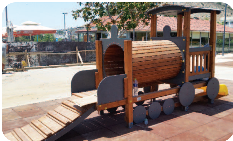
Ανακατασκευή παιδικής χαράς πάρκου Πρεσσόφ

2. Συντήρηση δημοτικού Κοιμωβητηρίου (50.000 ευρώ). Σημαντικές συντηρήσεις και παρεμβάσεις μέσα στον Αύγουστο που επιβάλλεται να γίνουν λόγω των καταστροφών που προκλή-