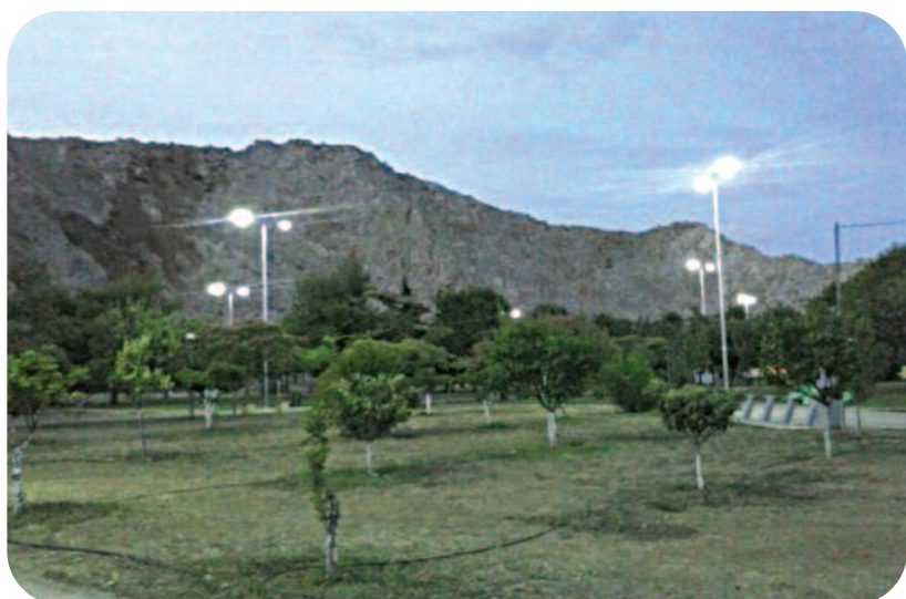
Νέος φωτισμός στο πάρκο Σελεπίτσари

αναγκαίων έργων ήδη εκτελείται, ενώ άλλα έχουν δρομοποιηθεί προς εκτέλεση. Στόχος μας είναι σε σύντομο χρονικό διάστημα οι υποδομές της πόλης να βρίσκονται σε ένα νέο, αναβαθμισμένο επίπεδο, βελτιώνοντας την ποιότητα ζωής των δημοτών.